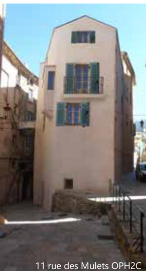
11 rue des Mulets OPH2C