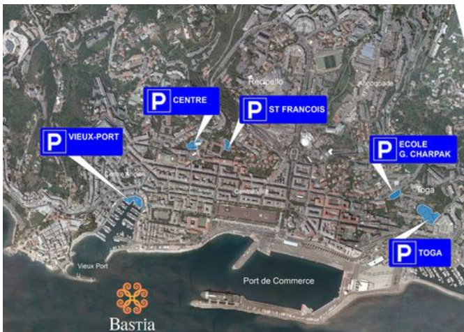
Parkings gratuits de Bastia