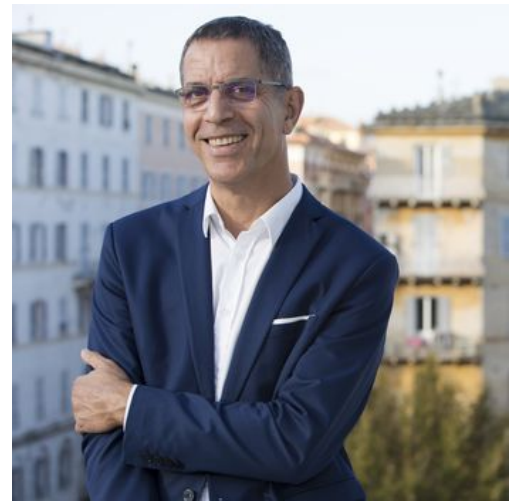
Merre di Bastia

L'élection de Gilles Simeoni à la fonction de Président du Conseil Exécutif de Corse provoque l'organisation de l'élection d'un nouveau Maire de Bastia. Candidat de la majorité municipale, Pierre Savelli est élu le 7 janvier 2016, Maire de Bastia.