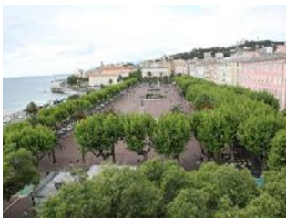
SALUBRITÉ DE L'HABITAT