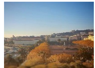
DÉSINFECTION, DÉRATISATION ET DÉSINSECTISATION (3D)