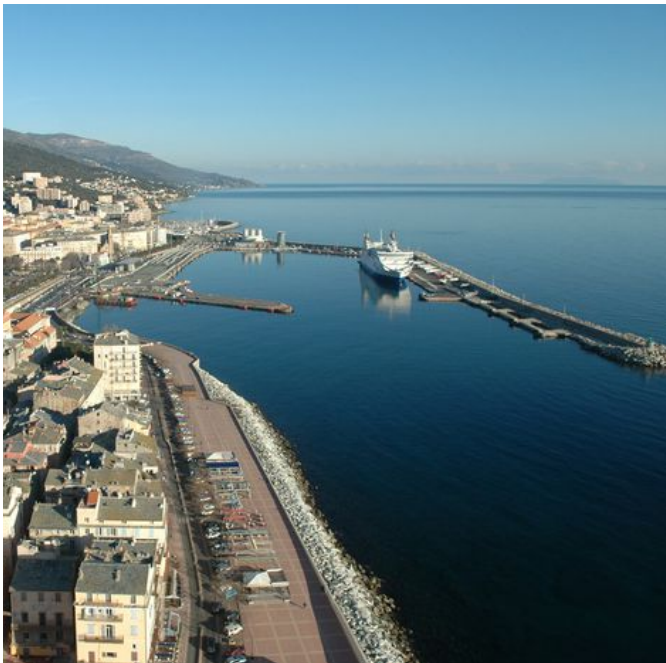
Port de commerce de Bastia