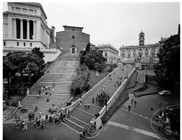
Colline du Campidoglio et basilique Santa Maria à Aracoeli, 2010