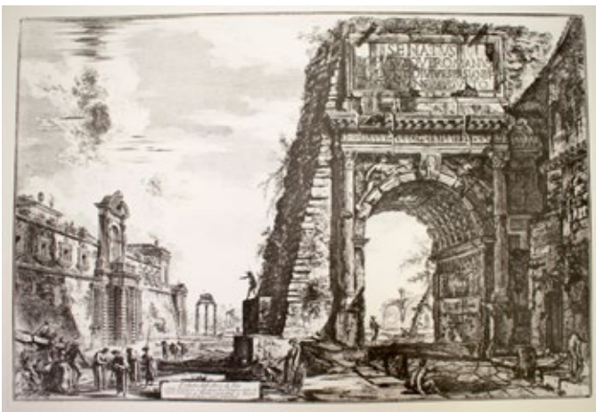
Arc de Titus, 1770 © Giambattista Piranesi