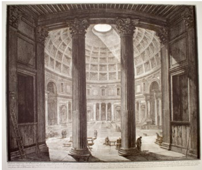
Intérieur du Panthéon, 1770 © Giambattista Piranesi

Ensemble comprenant 7 fac-similés de gravures à l'eau forte Collection Centre Méditerranéen de la Photographie