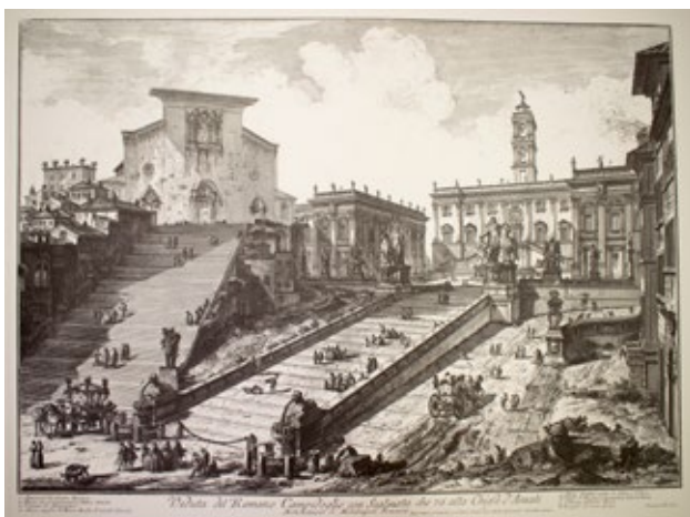
Colline du Campidoglio et basilique Santa Maria à Aracoeli, 1770 © Giambattista Piranesi