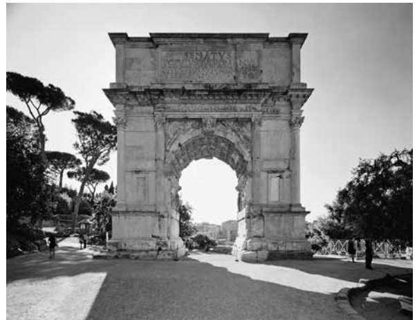
Arc de Titus, 2010 © Gabriele Basilico