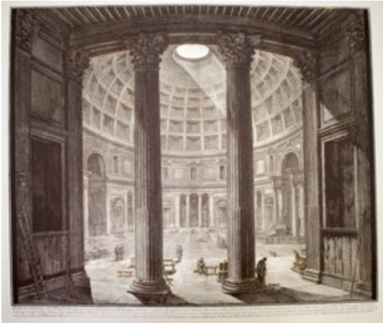
Intérieur du Panthéon, 1770 © Giambattista Piranesi