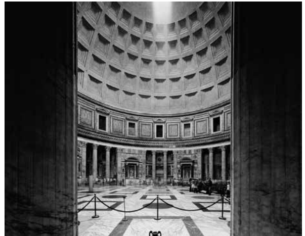
Intérieur du Panthéon, 2010 © Gabriele Basilico