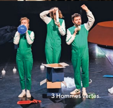
3 Hommes verts.