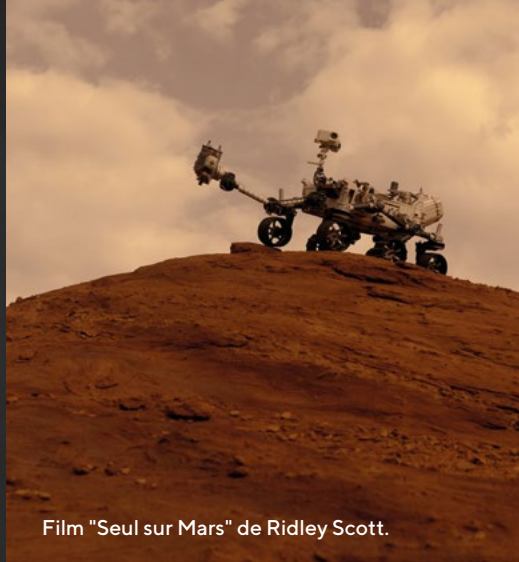
Film "Seul sur Mars" de Ridley Scott.