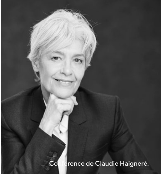
Conférence de Claudie Haïgnéré.