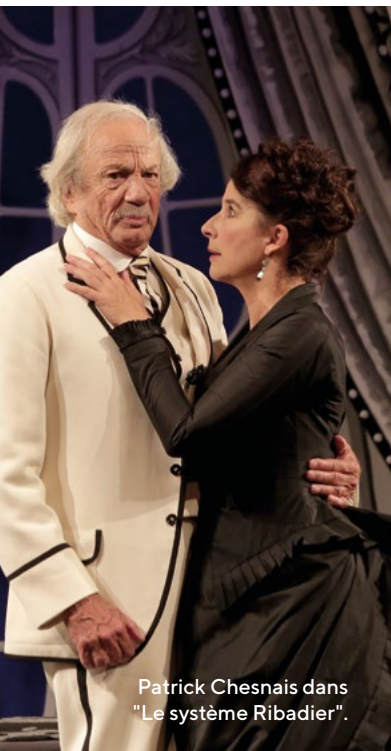
Patrick Chesnais dans "Le système Ribadier".