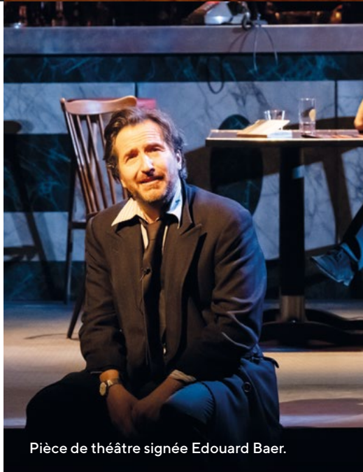
Pièce de théâtre signée Edouard Baer.