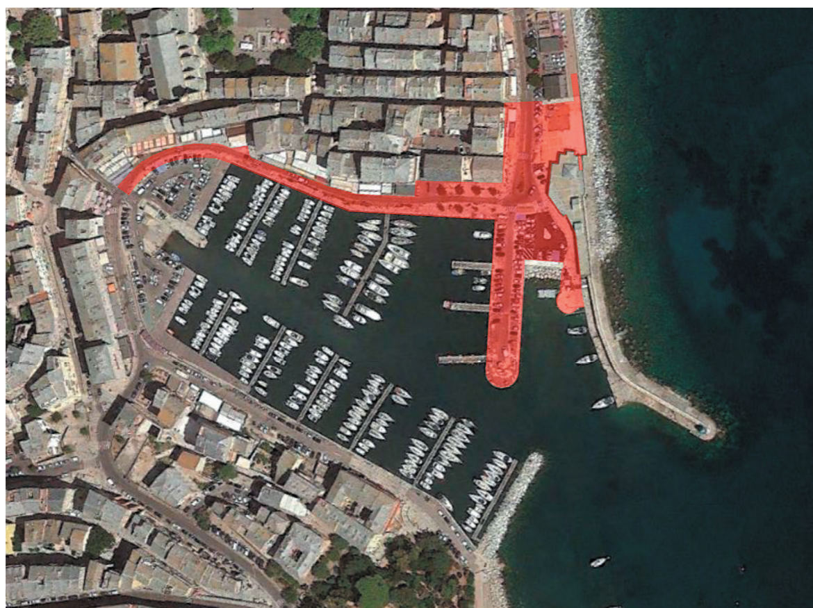
En rouge, l'étendue de la zone des travaux

Ces futurs travaux se situent en partie (15% de la surface du projet) dans une zone nécessitant un désamiantage rigoureux et conforme aux normes les plus strictes de sécurité.